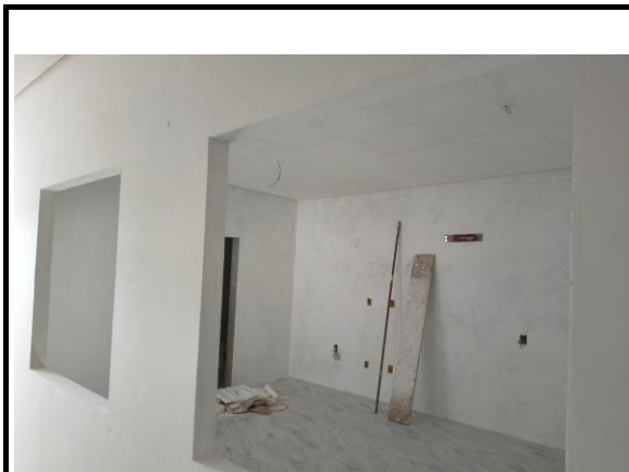
LATEX DUAS DEMÃOS EM PAREDES INTERNAS S/MASSA