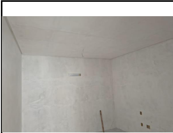
FORRO DE GESSO ACARTONADO ESTRUTURADO - FORNECIMENTO E MONTAGEM