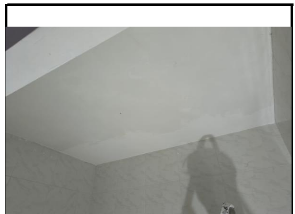
LATEX DUAS DEMÃOS EM PAREDES INTERNAS S/MASSA